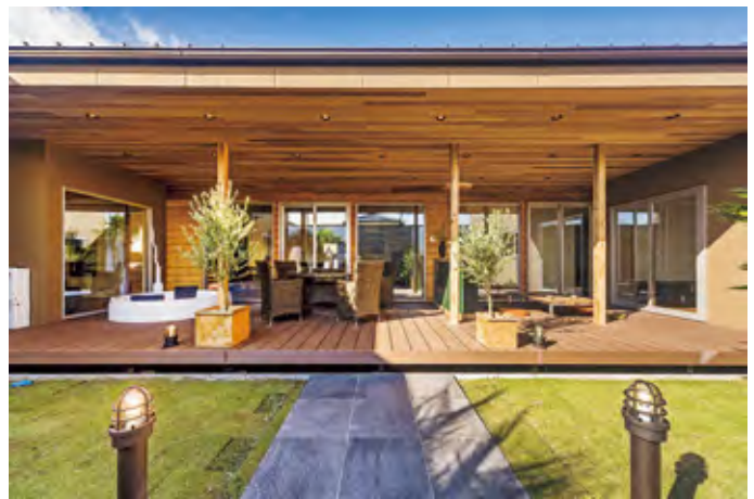
みどり小町 (全館空調システム)

お客様への対応が一番大事なことです。依頼を受けた事をより早く対応し、お客様が納得できる正確な情報提供し、ベストな価格提案をする事が、お客様の満足を得られる。これが私の信念です。お客様の立場に立って、心ある迅速な対応をする事で、お客様の笑顔とありがとうの輪が広がっていくと思います。それが、弊社の財産です。