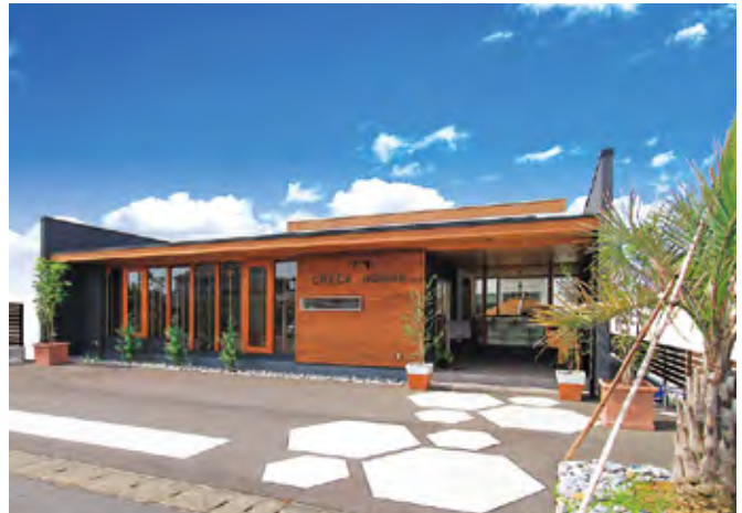
KITAGATA-SR「北方ショールーム」(本巣郡北方町)