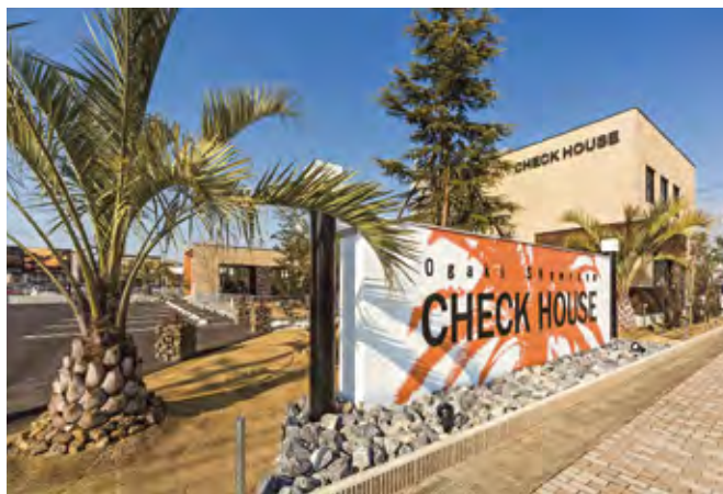
OGAKI-SR「大垣ショールーム」(大垣市中ノ江)

草野会長 注文住宅の設計施工が主な事業になります。又建売住宅分譲と一般的に言われる分譲ではなく、モデルハウスとしてコンセプトを決めた分譲住宅の設計施工販売をしております。又、住宅用地の開発、土地の売買も、お客様のニーズに合わせて、土地探しからの不動産営業をしております。又、近年は新築頂いたお客様よりのリフォーム工事の受注も増加しています。