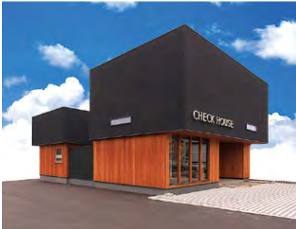
GIFU-SR「岐阜ショールーム」(岐阜市水海道)