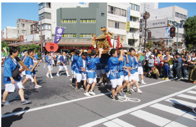
大垣十万石まつりの様子