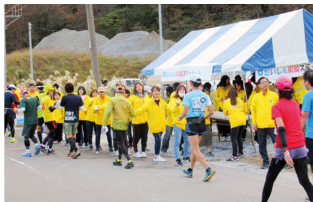
いびがわマラソン ボランティア参加の様子