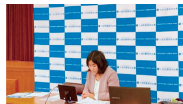
だいしんWEBセミナー