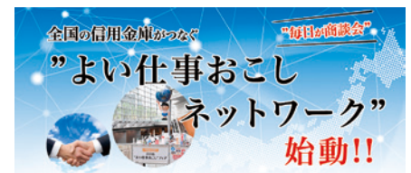
よい仕事おこしネットワーク

・2018年12月14日、城南信金・当金庫を含む全国24信金で「よい仕事おこしネットワーク」を立ち上げ、2019年6月からマッチングサイト「よい仕事おこしネットワーク」の運用を開始しています。全国信用金庫のネットワークを生かし、お取引先のマッチング情報の発信に取り組み、商談につながっています。