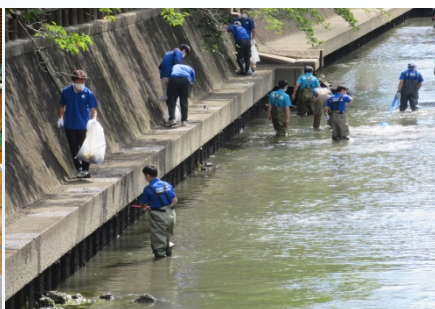
水門川クリーン作戦 令和4年7月30日