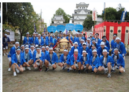
十万石まつり 令和4年10月9日