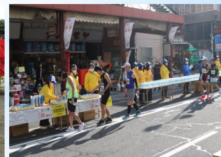
おおがきマラソン ボランティア参加 令和4年12月11日