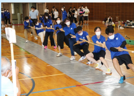
西濃綱引き選手権大会 令和4年6月26日